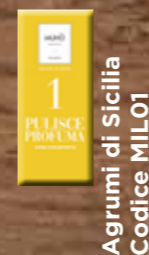
Agrumi di Sicilia Codice MIL01

White musk becomes more intriguing by blending feminine notes with a touch of enticing wood notes.