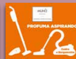
Cedro e Bergamotto Codice AS05