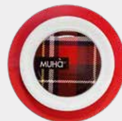
Melograno Codice CARS01