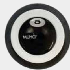
Legni Orientali Codice CARS03