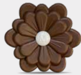
Legni Orientali Codice CARF13