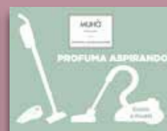
Cuoio e Frutti Codice AS08