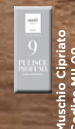
Muschio Cipriato Codice MIL09