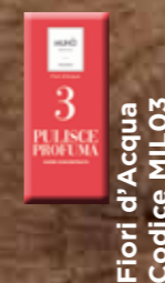
Fiori d'Acqua Codice MIL03