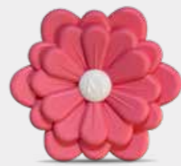
Uva e Fragola Codice CARF09