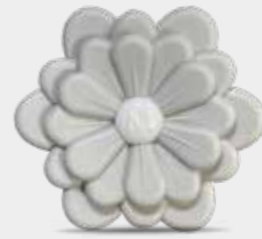
Acqua e Sale Codice CARF12