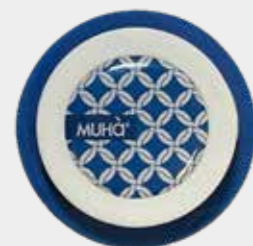
Legni e Tè Codice CARS02