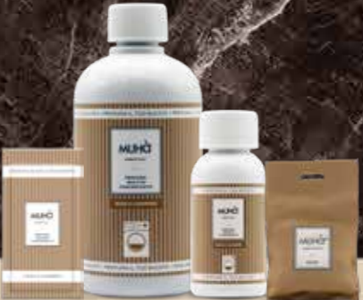
ROSA E CASHMERE