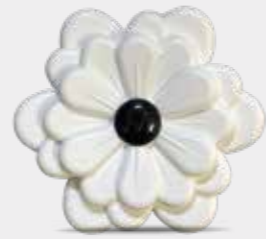
Fiori di Cotone Codice CARF05