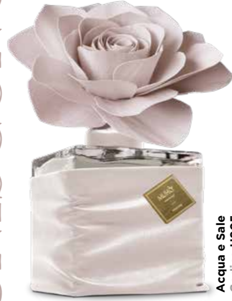
Acqua e Sale Codice H905 Ric. fiore Codice FIH34