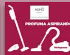
Melograno Codice AS04