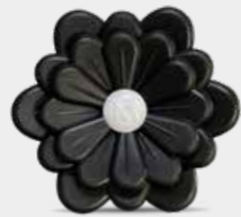
Legni e Tè Codice CARF02