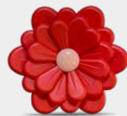
Arancio e Cannella Codice CARF01