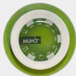
Uva Fragola Codice CARS05