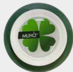
Vaniglia e Ambra Pura Codice CARS06