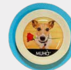
Legni Orientali Codice CARS11