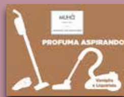
Vaniglia e Liquirizia Codice AS01