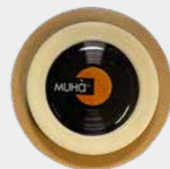
Cedro e Bergamotto Codice CARS07