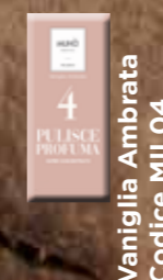
Vaniglia Ambrata Codice MIL04