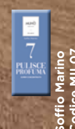
Soffio Marino Codice MIL07