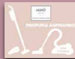
Lino e Cotone Codice AS03