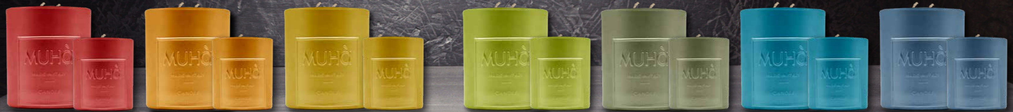
ARANCIO E CANNELLA CEDRO E BERGAMOTTO PEPE E GUAIACO MELA VERDE MOSTO SUPREMO MENTA E SANDALO MELOGRANO

70g Ø 57 H. 70 mm 22/25 ore 270g Ø 87 H. 98 mm 40/50 ore