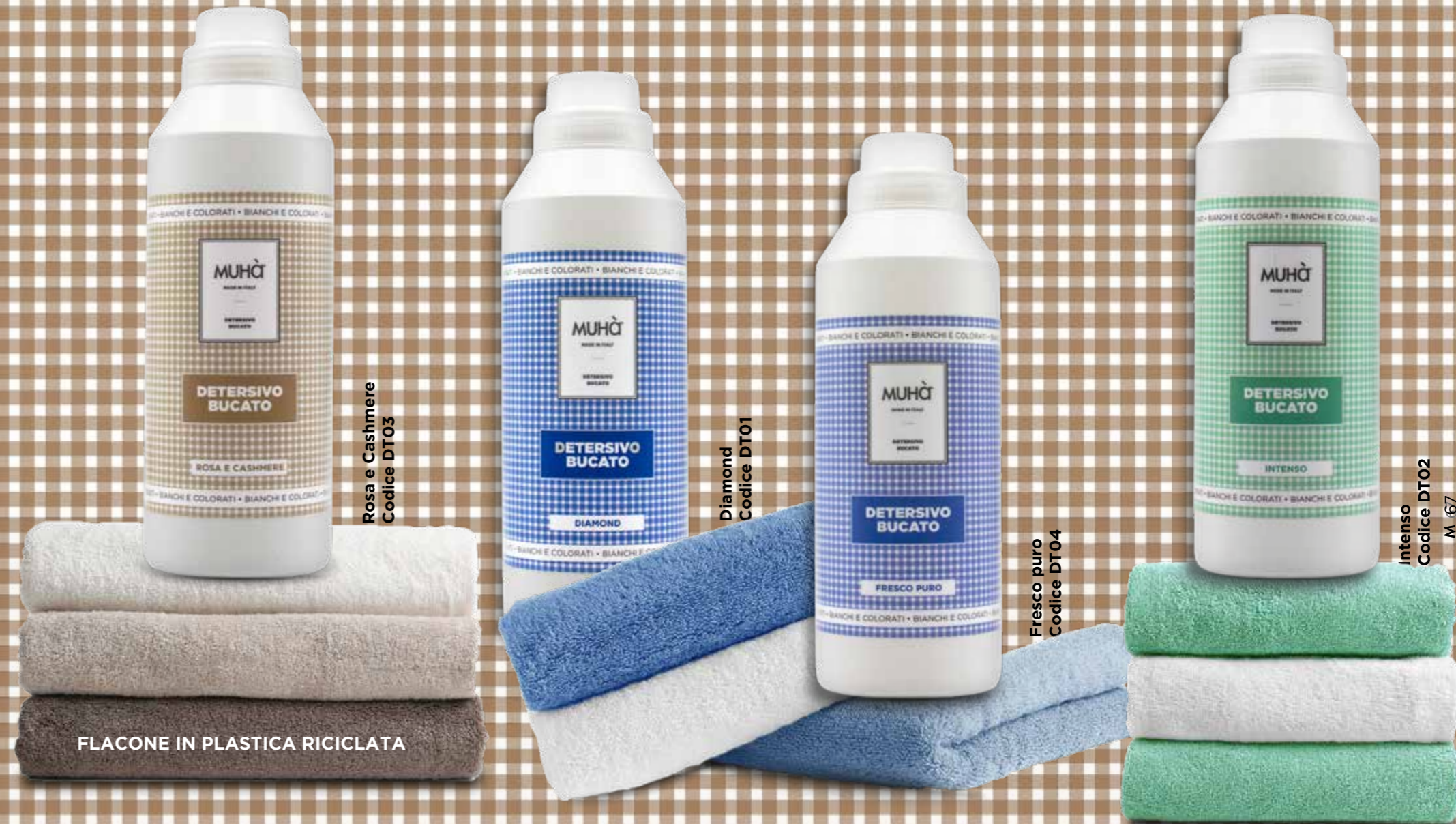
Rosa e Cashmere Codice DT03