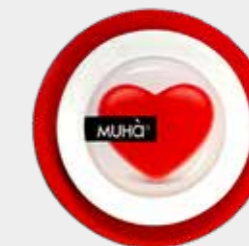
Melograno Codice CARS12