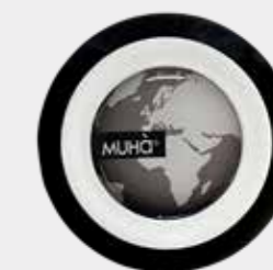
Fiori di Cotone Codice CARS14