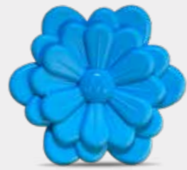
Brezza Codice CARF06