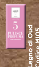
Legno di Oud Codice MIO5