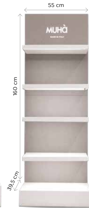
Con illuminazione led Codice EXPO03D