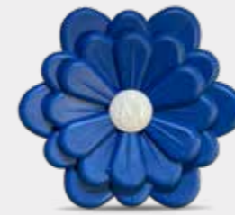
Artemisia e Cardamomo Codice CARF10