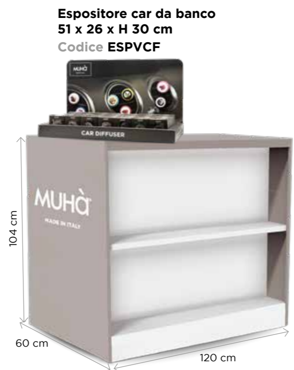
Banco Codice BANCO01