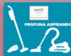
Menta e Sandalo Codice AS02