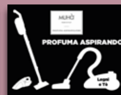
Legni e Tè Codice AS07