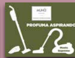
Mosto Supremo Codice AS06