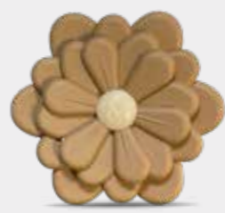
Vaniglia e Ambra Pura Codice CARF03