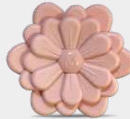
Pompelmo e Tè Codice CARF08