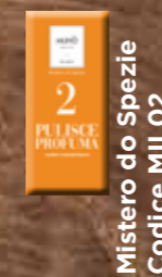
Mistero di Spezie Codice MIL02