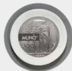
Acqua e Sale Codice CARS04