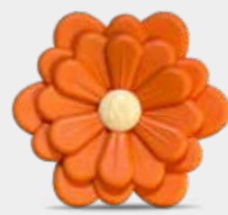
Cedro e Bergamotto Codice CARF04