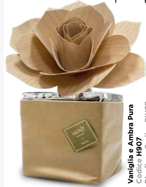
Vaniglia e Ambra Pura Codice H907 Ric. fiore Codice FIH37

A refined home fragrance, designed in soft eco-leather and accessorized with an elegant birch wood diffuser. Complete with essence 500 ml.