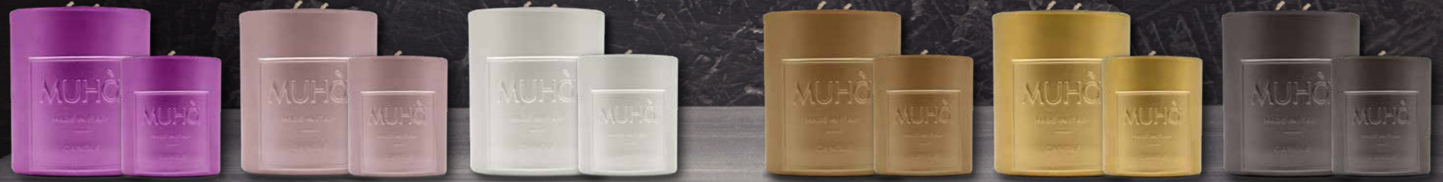
FRUTTI TROPICALI LINO E COTONE ACQUA E SALE VANIGLIA E LIQUIRIZIA UVA E FICO FIORI DI COTONE