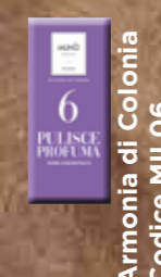
Armonia di Colonia Codice MIL06