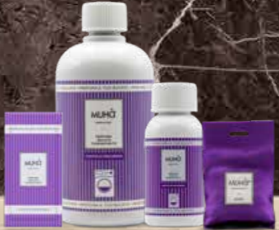
SOFFIO DI PROVENZA