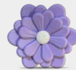
Melograno Codice CARF14