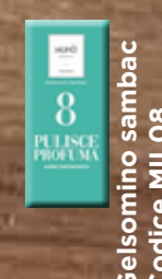
Gelsomino sambac Codice MIL08