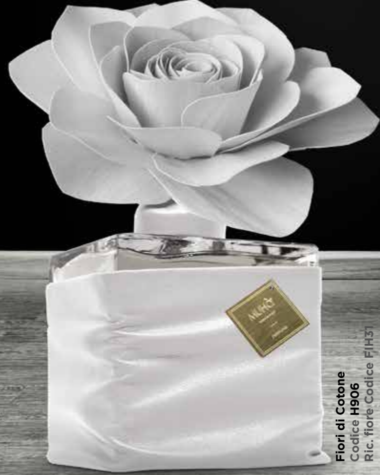
Flori di Cotone Codice H906 Ric. fiore Codice FIH31