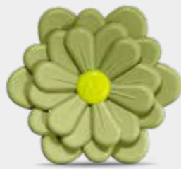
Mosto Supremo Codice CARF07