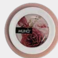
Pompelmo e Tè Codice CARS08