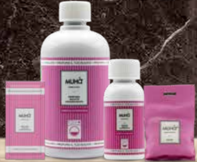
CAREZZA DI PRIMAVERA