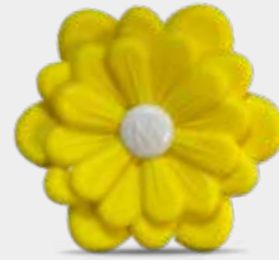
Lemon Fritz Codice CARF11