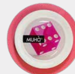
Uva e Fragola Codice CARS09