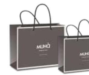
SHOP02 32•13•20 CM SHOP03 25•11•20 CM