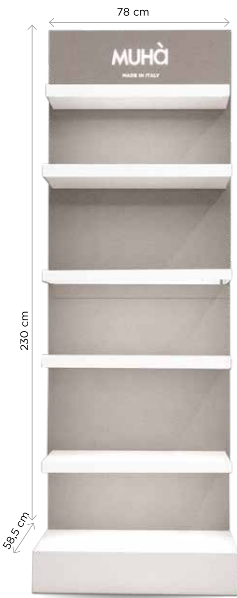
Con illuminazione led Codice EXPO01D