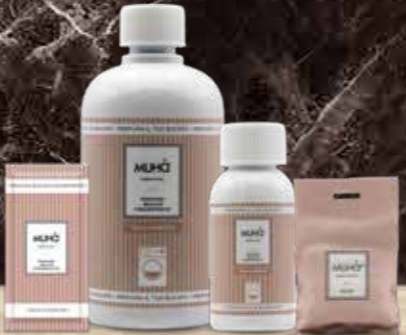
TALCO E MUSCHIO